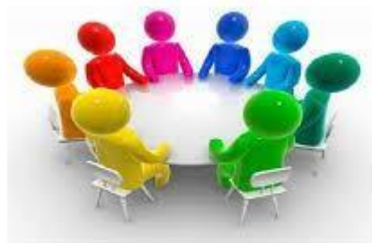
Consiglio di Istituto