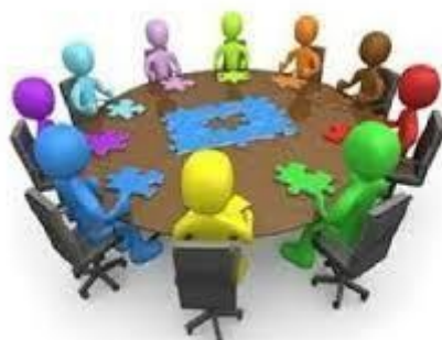
COMITATO VALUTAZIONE DOCENTI