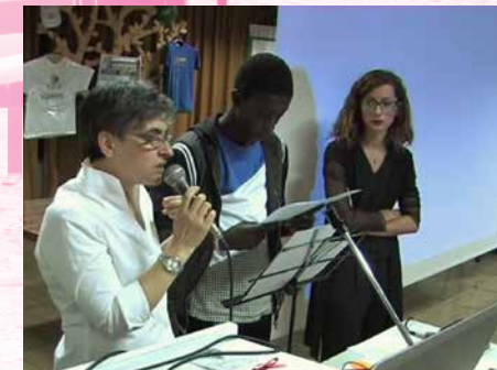
Festa dei lettori