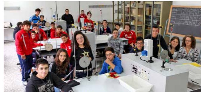
Laboratorio di Fisica