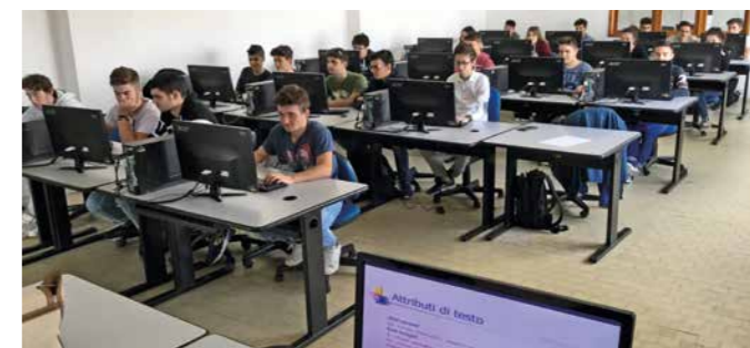
Laboratorio di Sistemi