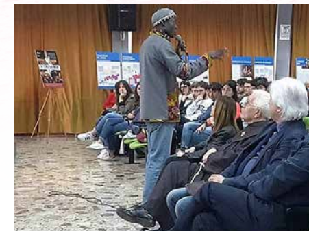
Per un'etica dell'accoglienza