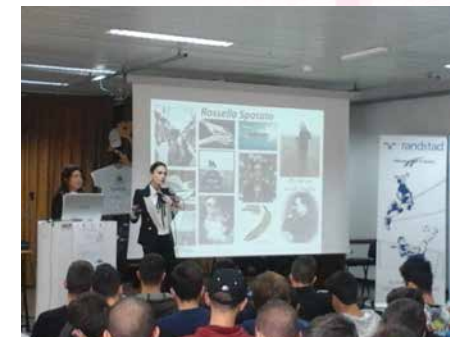
Allenarsi per il futuro con il gruppo BOSCH