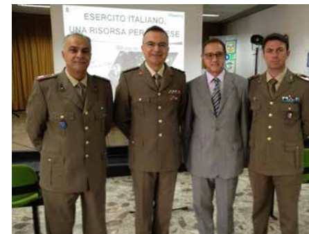
Esercito Italiano: una risorsa per il paese