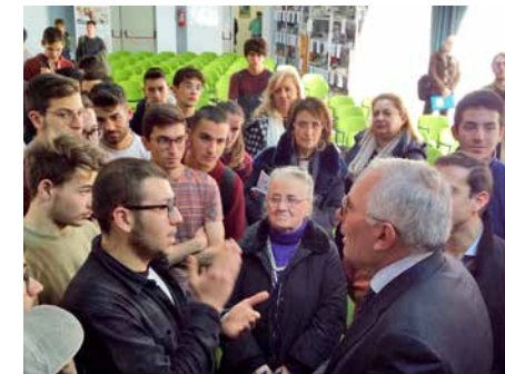
On. Gero Grassi - Centenario della nascita di Aldo Moro