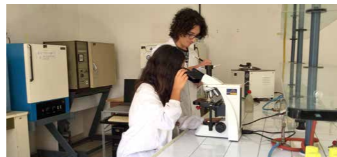
Laboratorio di Microbiologia