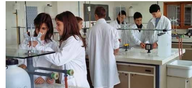
Laboratorio di Chimica Generale