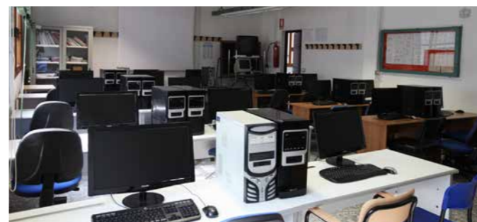
Laboratorio di Tecnologia e Disegno