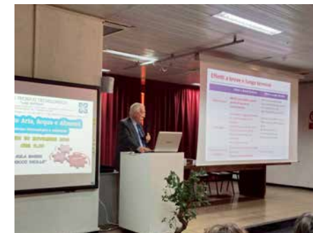
Inquinamento Aria, Acqua ed Alimenti