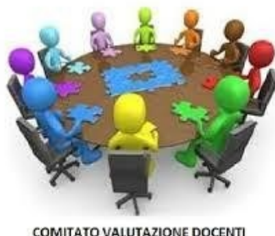
COMITATO VALUTAZIONE DOCENTI