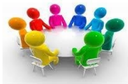
Consiglio di Istituto